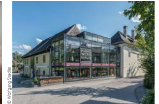
Hand.Werk.Haus in Bad Goisern