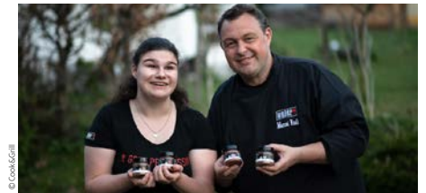
Cook&Grill – die soziale Gewürzmanufaktur